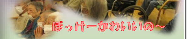
ぼっけーかわいいいの～