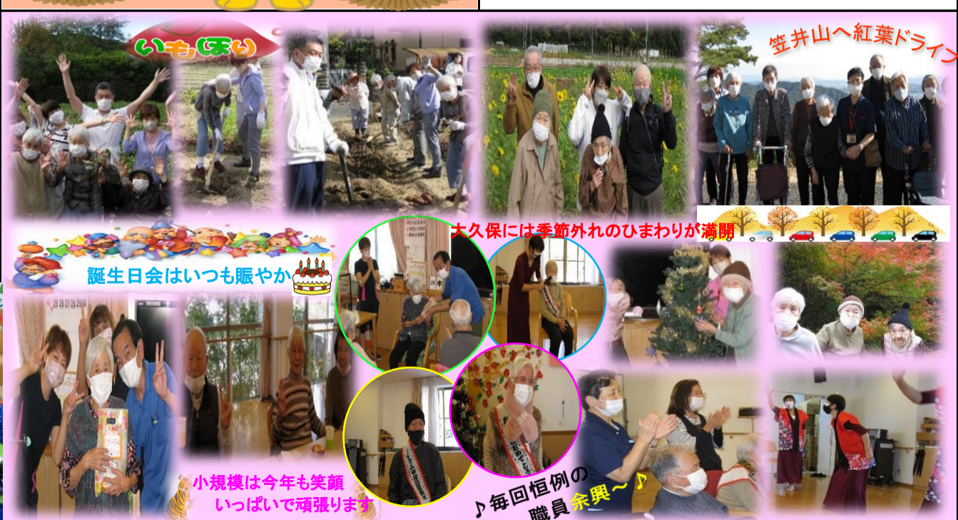
誕生日会はいつも賑やか