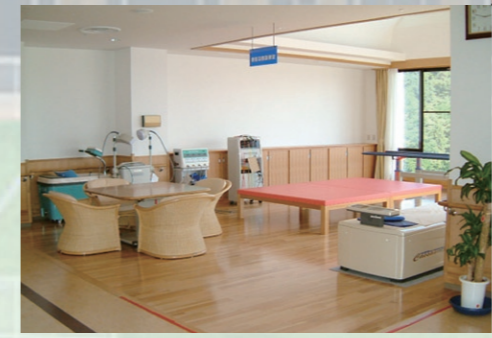
リハビリテーション