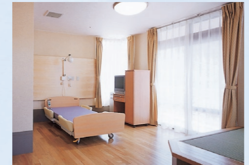
豊かな空間と時間を・個室