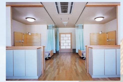
みんなと楽しく・4人部屋