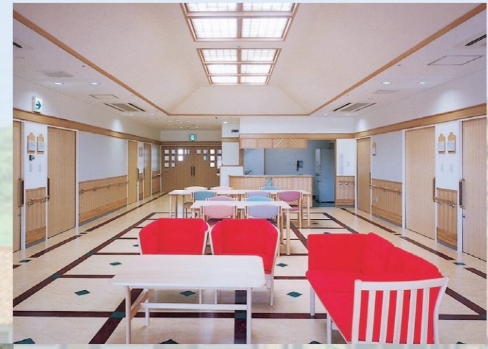
談話スペース・食堂